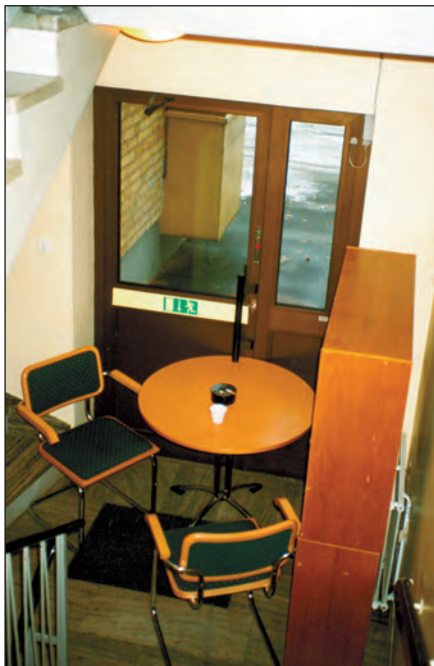
Så här får det inte se ut. Rökhörna i utrymningsväg.

Det är röken som dödar. Vid alla bränder utvecklas giftig rök. Brandröken innehåller många olika giftiga ämnen,