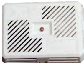
Brandvarnare är en billig livförsäkring.

En brandvarnare är en självklarhet i varje bostad. Brandvarnare räddar årligen många liv och är en av de billigaste livförsäkringar som du kan ha! De flesta dödsbränder inträffar under nattetid. Orsak är ofta sängrökning, kvarglömt ljus eller elfel.